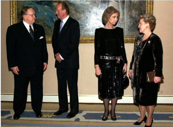
Los entonces Reyes de España, junto al antiguo presidente de Finlandia, Martti Ahtisaari y su esposa, Eeva Ahtisaari, durante la visita oficial que realizaron a España.