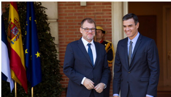
El presidente del Gobierno Pedro Sánchez, durante su reunión con el anterior primer ministro de Finlandia, Juha Sipilä.- Madrid 04/10/2018. Palacio de La Moncloa.