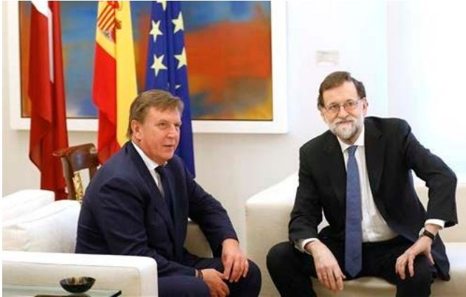
El presidente de Gobierno D. Mariano Rajoy junto al primer ministro de Letonia, Māris Kučinskis. Palacio de la Moncloa. Madrid, 17 de enero de 2018