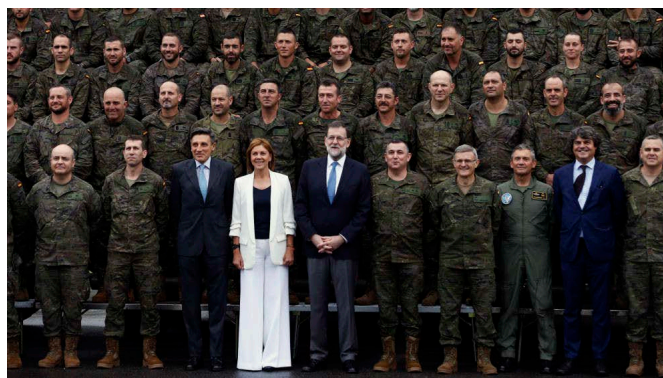
El presidente del Gobierno, Mariano Rajoy, acompañado de la ministra de Defensa, María Dolores de Cospedal. Letonia, 24 de julio de 2017