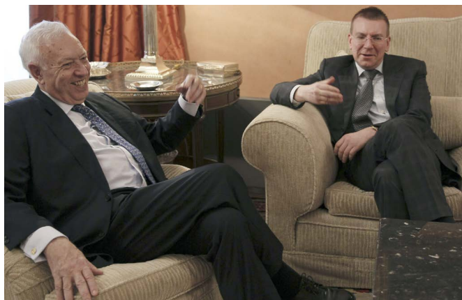
El anterior ministro de Asuntos Exteriores y de Cooperación, José Manuel García-Margallo junto a su homólogo letón, Edgars Rinkevics, durante su encuentro en el Palacio de Viana, en abril de 2014.

En enero, el Ministro de Finanzas letón Andris Vilks y el Gobernador del Banco Letón, I. Rimsevics, visitaron Madrid entrevistándose con el Ministro de Economía, el Gobernador del Banco de España y el asesor económico del Presidente. El principal objetivo era recabar el apoyo español con vistas a la entrada en el euro y el ingreso en la OCDE.