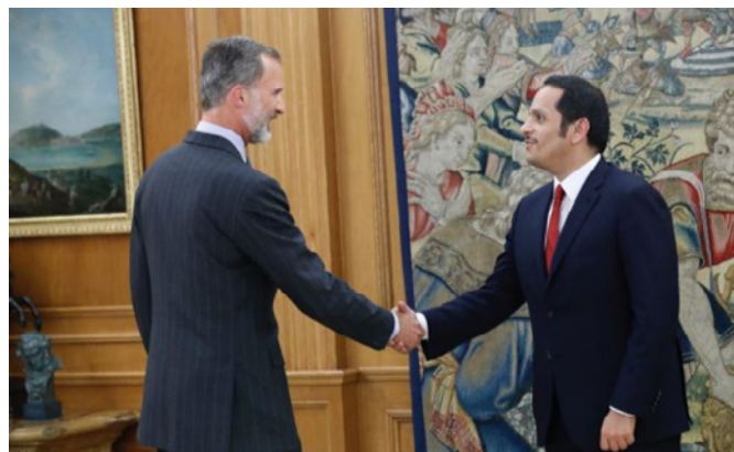
SM el Rey recibe el saludo del vice primer ministro y ministro de Asuntos Exteriores del Estado de Catar, su excelencia el Jeque Mohammed Bin Abdulrahman Al-Thani.- Palacio de La Zarzuela. Madrid, 13.09.2018.

Las relaciones económicas entre ambos países se verán favorecidas con la entrada en vigor el pasado 6 de febrero de 2018, del Convenio de Doble Imposición entre Catar y España.