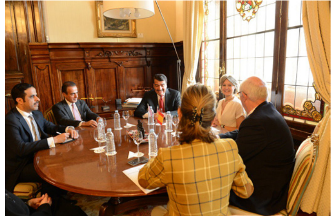
SE el Ministro de Municipalidad y Medioambiente catarí, Abdullah Al Rumaihi, visitó España, manteniendo un encuentro con la anterior Ministra de Agricultura, Pesca, Alimentación y Medio Ambiente, Dª Isabel García Tejerina. Madrid, 10 de Mayo de 2017.

cas cataríes. Tuvo asimismo un encuentro con las empresas españolas sitas en Catar.