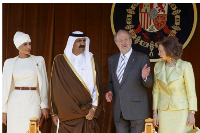
Los reyes de España, junto al emir de Catar y su esposa, durante la visita oficial que realizaron a España en abril de 2011.